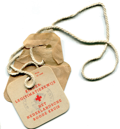
▲ In 1943 stelde het Rode Kruis kinderlegitimatiewijzen beschikbaar voor kinderen tot 15 jaar. Ze waren vier bij vier centimeter, niet verplicht, kostten een dubbeltje en werden gemaakt bij Johan Enschedé.