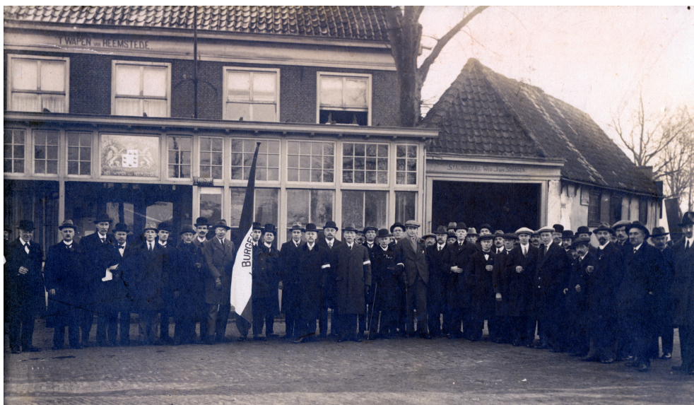
► De Heemstedse burgerwacht voor het Wapen van Heemstede, 1918.