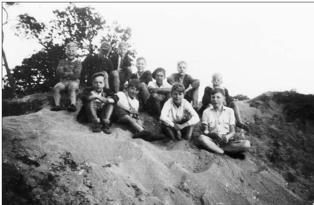
“Een dagje naar de duinen met mijn jongens.”

De kinderen in Bosbeek hadden nooit contact met hun ouders, maar op moederdag 1946 had de directrice geregeld dat de kinderen bij de kazerne langs mochten gaan om bloemen te brengen. De dag ervoor gingen de leidsters met de kinderen buiten bloemen plukken en werden er boeketjes gemaakt. Op moederdag werden de kinderen klaar gemaakt om op bezoek te gaan, de meisjes kregen mooie strikken in het haar. Achter op een laadbak van een klein vrachtautootje gingen ze zingend naar de kazerne. “Ik was thuis gebleven en op een gegeven moment zag ik de kinderen huilend terugkomen. Het bleek dat de bewaker van de kazerne ze niet had toegelaten. Hij had niets door gekregen en de directeur en commandant waren er niet, dus hij liet niemand toe, ook de kinderen niet. Die kwamen met bloemen en al weer terug. Wij waren allemaal woedend. De directrice heeft nog gebeld, maar het leed was al geschied.”