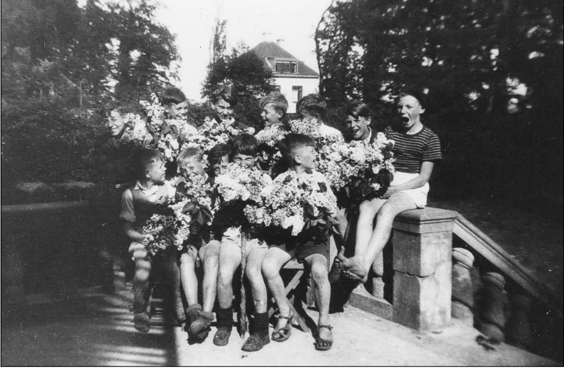
“Met bloemen voor moeder, nu nog vrolijk! Toelating kazerne geweigerd; dramatisch.”