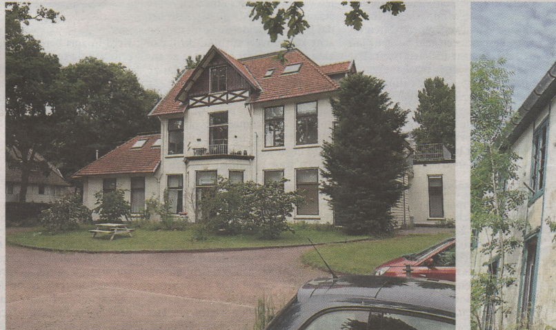
De inmiddels gesloopte villa Meerlhorst.