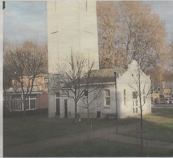
De huidige en toekomstige situatie aan de Nijverheidsweg.