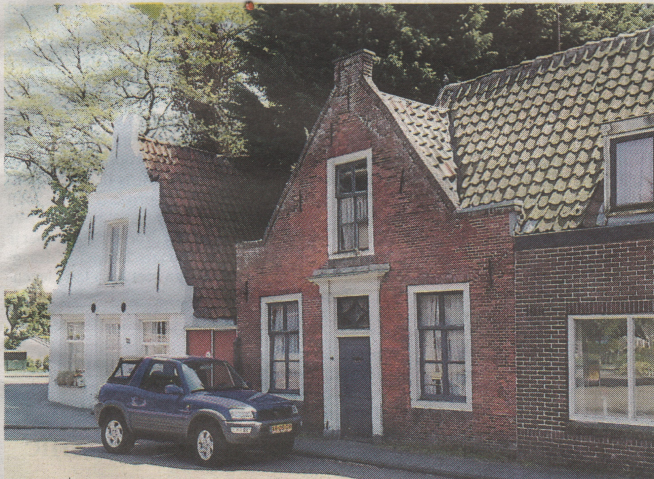
Glipperweg 70, dat plaats maakt voor een hofje.

„Steeds als we de gemeente vroegen om iets te doen was de reactie: we weten nog niet wat we met dat gebied gaan doen, dus kunnen we niet zoveel. Vanuit de eigenaar een