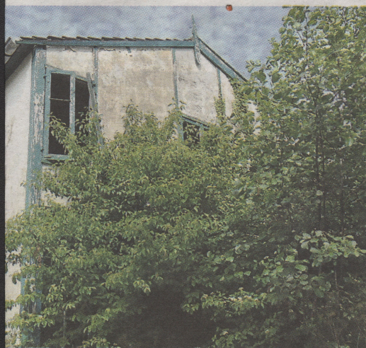
De zwaar vervallen bollenschuur aan de Manpadslaan.