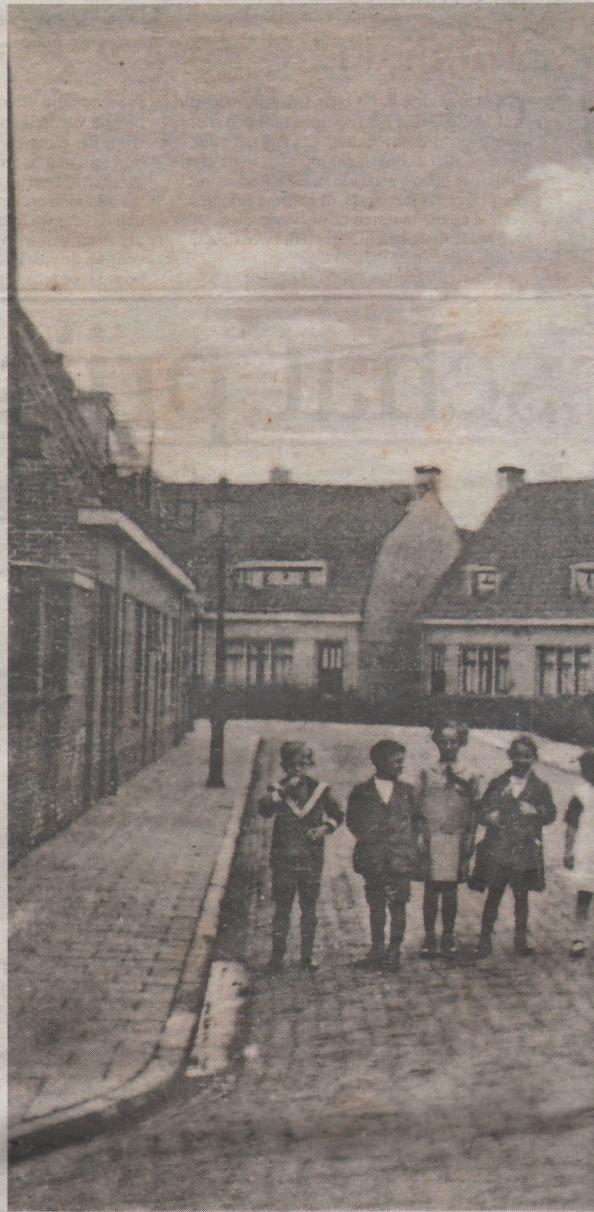
Een autloze Balistraat waarin volop kan worden gespeeld.