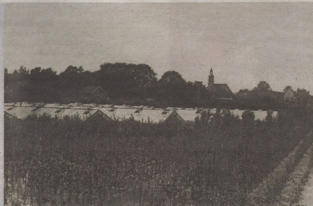
Fruittwekerij Insulinde, waaraan de straten hun naamgeving danken.