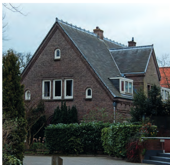
▲ Ook bij de pastorie is op veel plaatsen de 'drievoudigheid' te zien, bijvoorbeeld in de aantallen ramen. Opvallend zijn ook het fraaie metselwerk en het in decoratieve vormen geklopte lood langs de dakranden.

was één van de eerste grote gereformeerde kerken die, mede naar de inzichten van Abraham Kuiper, gebouwd werden. Dondorp sprak over de symbolen die Jonkheid de kerk had meegegeven: de zevenvuldigheid in de zeven traveeën van het schip van de kerk, de drievoudigheid in de drie frontingen, bogen en zijramen en het woord dat centraal stond doordat alle constructielijnen van bogen en kerkspanten één middelpunt vonden in de bijbel op de kansel. Dominee Brouwer, sinds 1918 in Heemstede in functie, had boven de ingang van de kerk het opschrift laten aanbrengen 'Uw Woord is de Waarheid'. Hoewel de kerk al in mei 1921 in gebruik genomen was, verschenen beoordelingen in de pers pas toen in 1922 ook de pastorie en de kosterij voltooid waren. Haarlems Dagblad noemde de kerk in 1922 'den deftigen kerk' met een 'wijdingsvol cachet' en de Haagsche Courant beschreef de kerk als 'een lust voor het oog en een sieraad voor de omgeving'.