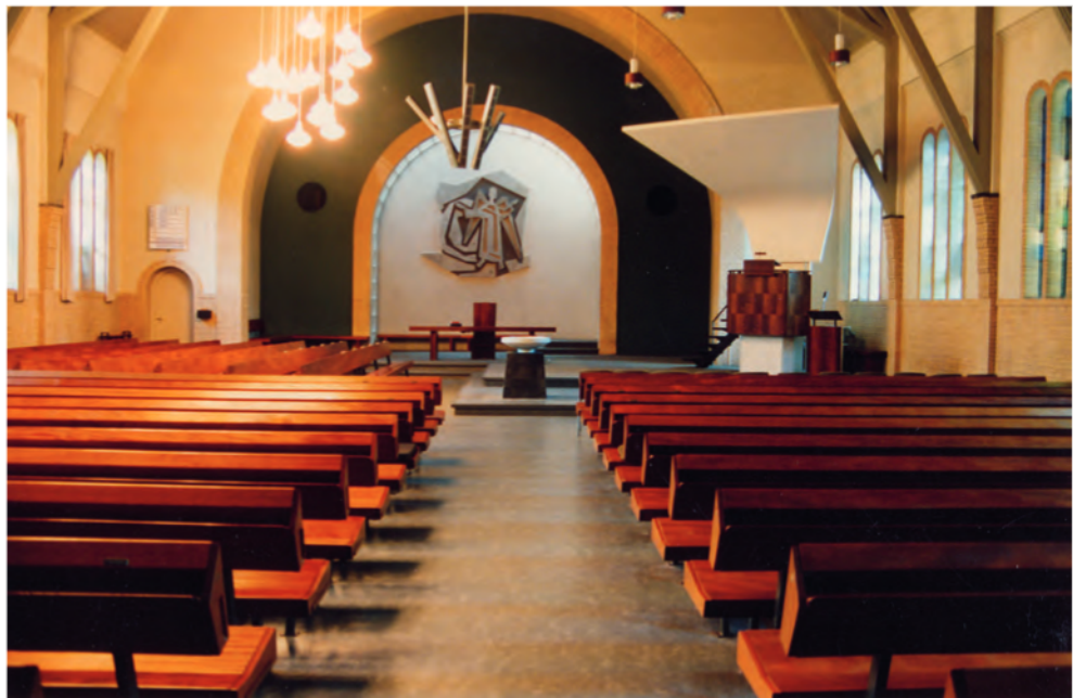
► De veel lichtere en modernere kerk na de renovatie in 1962.

De in oktober 1962 heropende kerk kreeg in Trouw en het Haarlems Dagblad lovende besprekingen. 7 De 'oude sombere preekkerk' was veranderd in een 'echte gemeentekerk', de 'donkere pijpenla' in 'een lichte blijmoedige ruimte'. Waar eerst de zware houten kansel stond, was nu de avondmaaltafel. De kansel was naar rechts opzij verplaatst en ook de opstelling van de banken