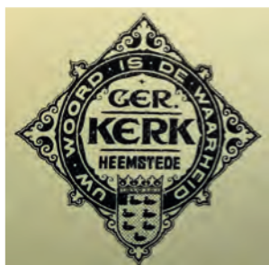
▲ Dit fraaie logo gebruikte de kerk in 1925.

kerk te worden. (...) Het gebouw, dat ongeveer 600 zitplaatsen zal bevatten, komt met het front gedeeltelijk aan de Koediefslaan en aan een aldaar nieuw geprojecteerden weg. 2 De fundering voor de toren was gelijk met de rest van de kerk gebouwd, maar de beslissing om de toren daadwerkelijk te bouwen viel pas toen de kap op de kerk lag. De kerk kostte 95.000 gulden en de toren nog eens 30.000 gulden extra. Het duurde nog geruime tijd voor ook de pastorie en de kosterij met vergaderruimten aan weerszijden van de kerk af waren.