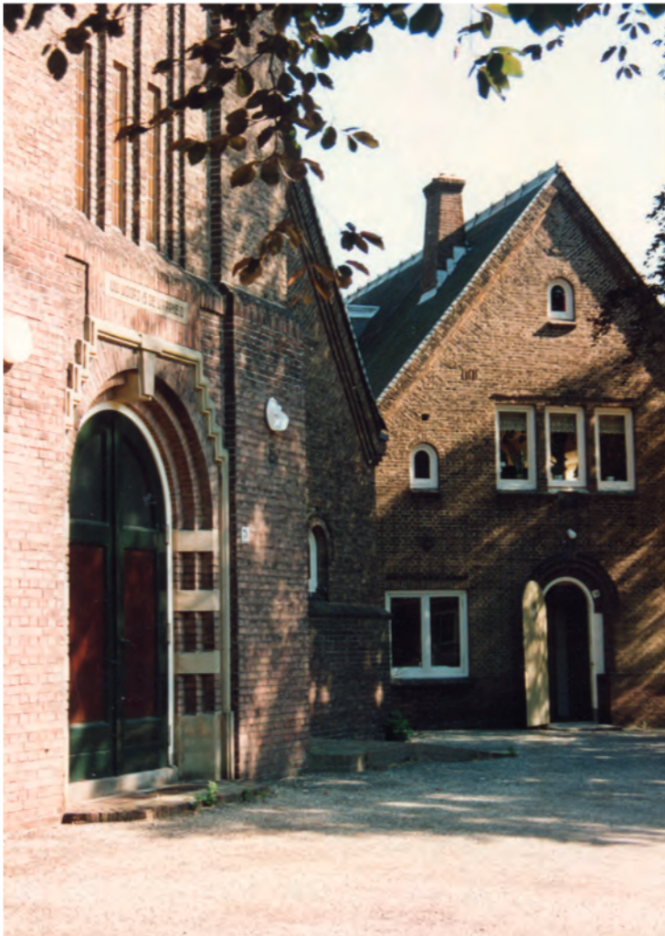
▲ De ingang van de kerk en de kosterij.