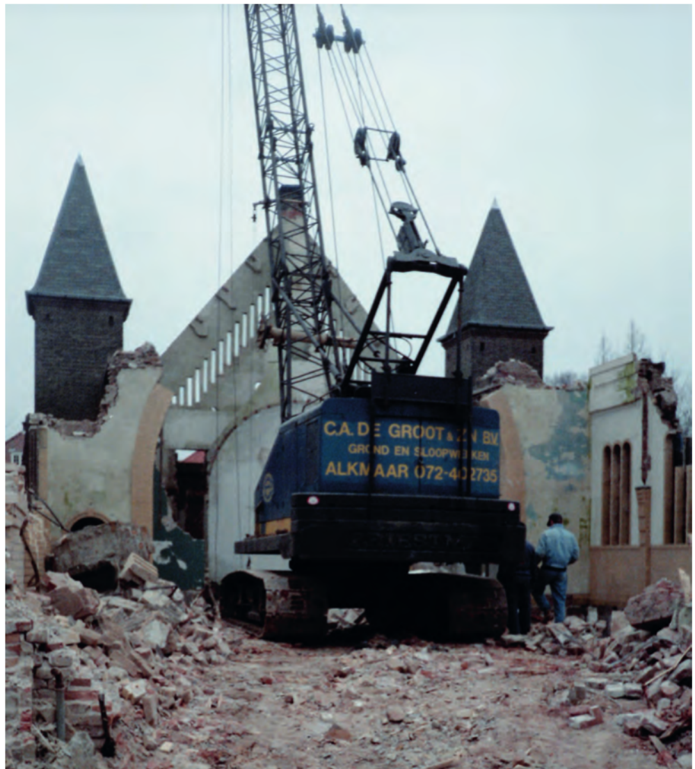
► De achterste twee torentjes van de kerk staan hier nog overeind.