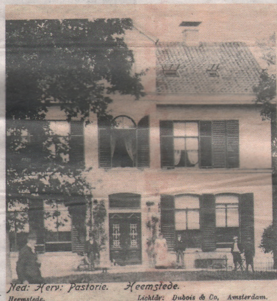
Ned. Herv. Pastorie. Heemstede. Lichtdr. Dubois & Co, Amsterdam.