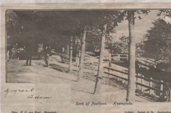
Kerk of Postlaan. Heemstede.