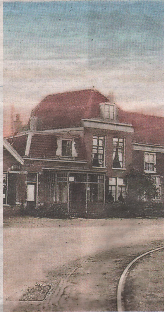
Het Wilhelminaplein in 1901, het Wapen van Heemstede nog in volle glorie.