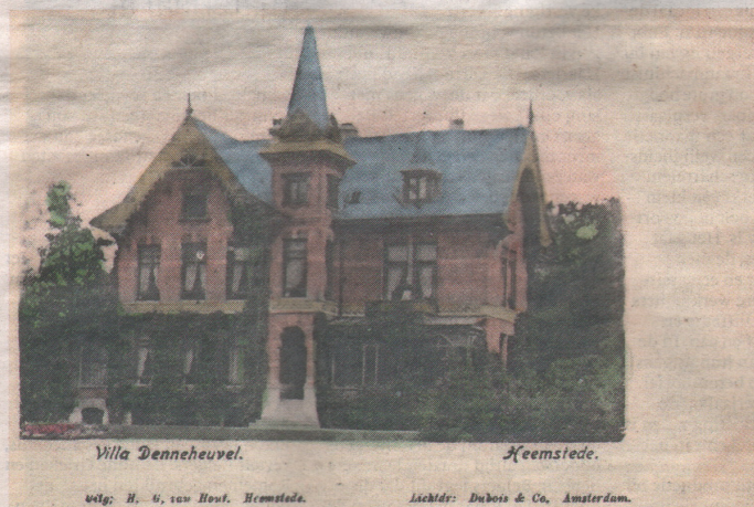
Villa Dennenheuvel. Heemstede.

Het nieuwe nummer van Heerlijkheden is voor 4,95 euro te koop op diverse plekken in Heemstede, onder meer bij boekhandel Blokker.