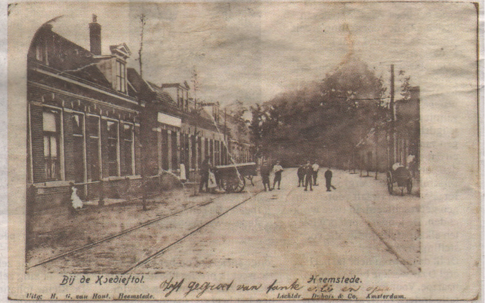
De Koedieftol. De tol kwam vooral van verkeer van en naar de net leeg gepompte Haarlemmermeer.