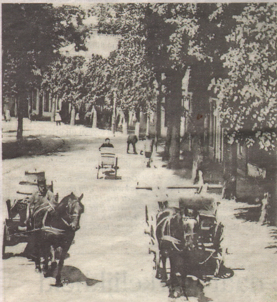
Het Wilhelminaplein gezien vanaf de Oude Kerk.