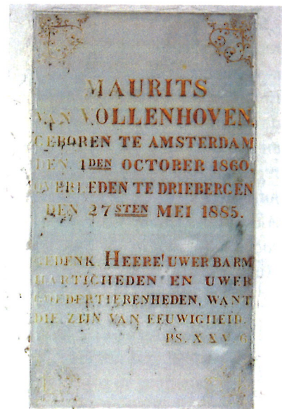
▲ De marmeren platen in de voorhal van de grafkapel.