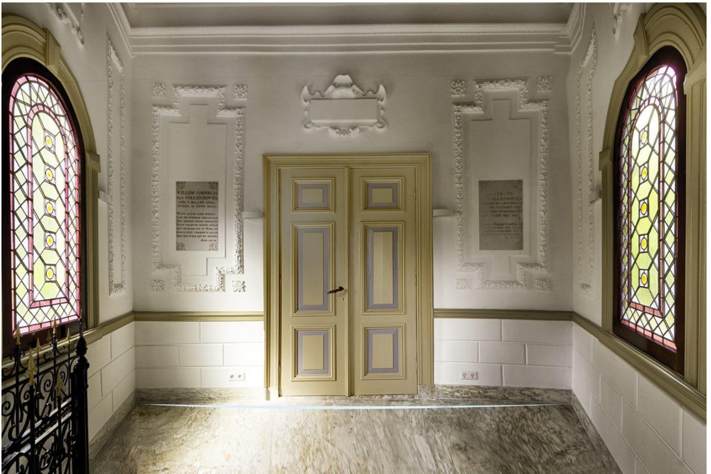
Interieur grafkapel Van Vollenhoven na restauratie, 14 juni 2022