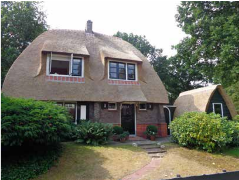
▲ Grote Sparrenlaan 1, een van de eerste villa's die in Het Duin gebouwd werd omstreeks 1925 (foto 2017).