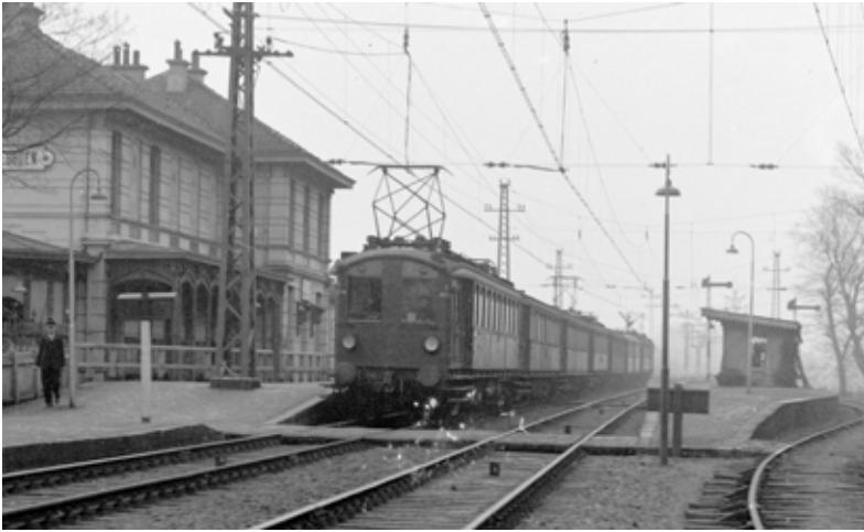
▲ De trein richting Haarlem stopt bij station Vogelenzang-Bennebroek, circa 1935.