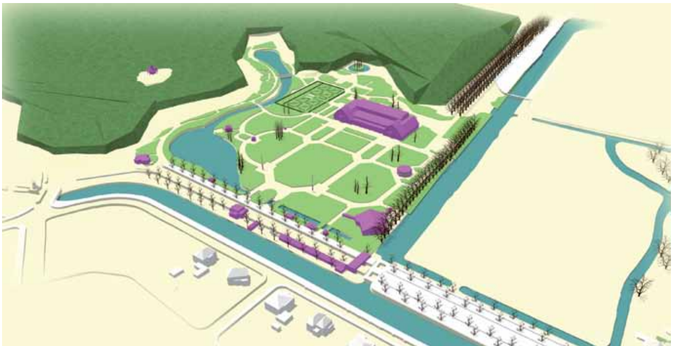
Vogelvluchtperspectief van de 'Internationale Voorjaars Bloemententoonstelling Haarlem (Heemstede) 1925' vanuit het noordoosten.