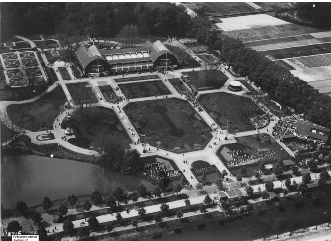
Het Floraterrein van 1925 vanuit de lucht gezien.