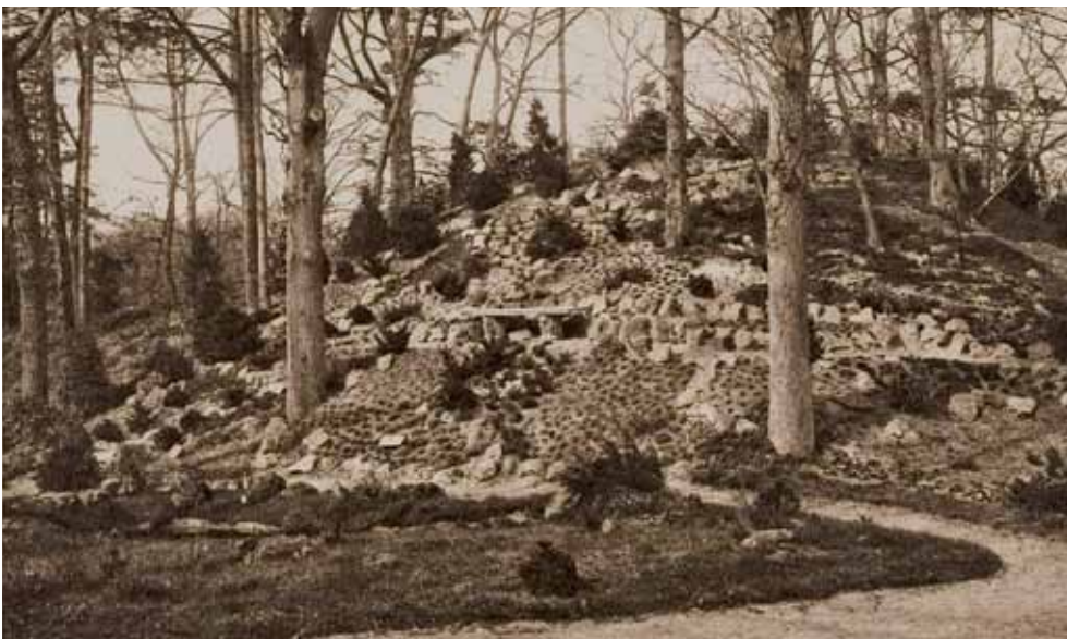
1925-3: De succesvolle rotstuin van de tentoonstelling in 1910 te Haarlem werd ook in Groenendaal weer in een andere vorm aangelegd.