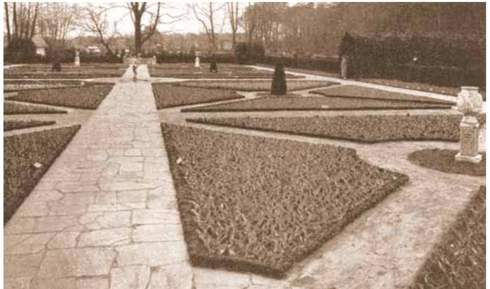
1925-2: De geometrische bloemperken in de 'Oud Hollandsche Tuin'.