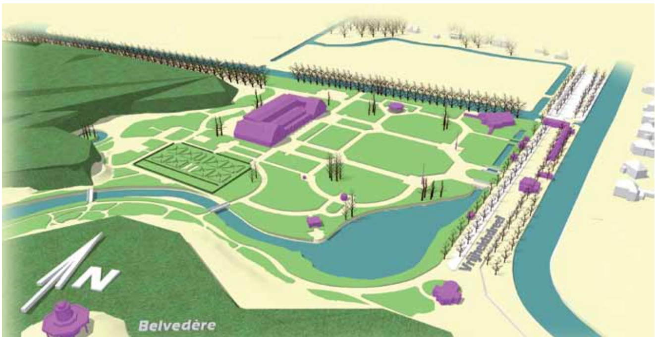
Vogelvluchtperspectief van de 'Internationale Voorjaars Bloemententoonstelling Haarlem (Heemstede) 1925' vanuit het zuiden. (Deze perspectieven van de gebouwde situatie kunnen afwijken van de plattegrond.)