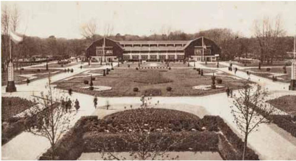
1925-1: Het hoofdtentoonstellingsgebouw gezien nabij de Vrijheidsdreef.