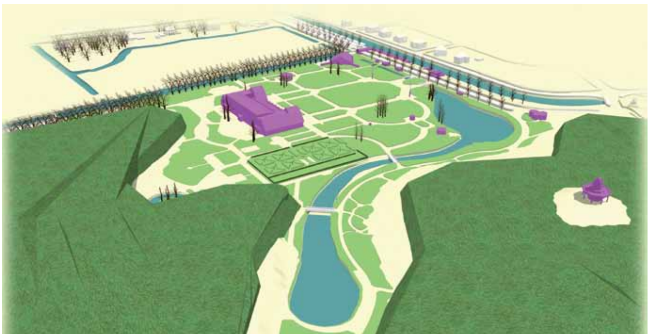
Vogelvluchtperspectief van de 'Internationale Voorjaars Bloemententoonstelling Haarlem (Heemstede) 1925' vanuit het zuidwesten.