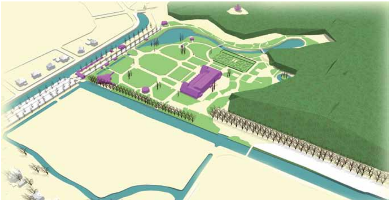
Vogelvluchtperspectief van de 'Internationale Voorjaars Bloemententoonstelling Haarlem (Heemstede) 1925' vanuit het noordwesten.