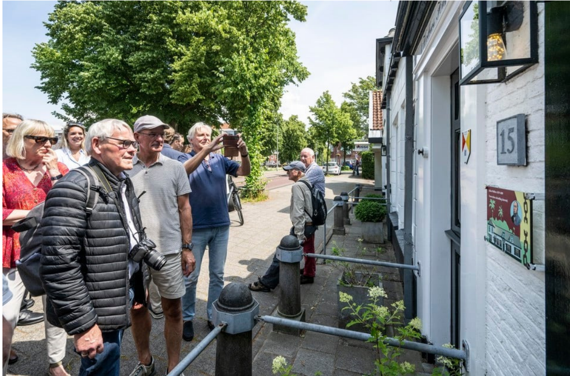
Wolbers woonde meer dan 200 jaar geleden in dit huis, waar ook het bord onthuld is.

Als historische vereniging willen ze het verleden zichtbaar, hoorbaar en tastbaar maken. Daarom hangt er bij het gedenkbord een QR code die voorbijgangers kunnen scannen om meer te leren over de afschaffing van slavernij in Suriname en wat er daarna gebeurde. „Zo hopen we meer bewustzijn te creëren voor deze beladen periode in de geschiedenis.”