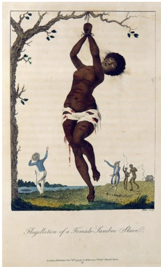
Afbeelding van een geseling van een tot slaaf gemaakte, afkomstig uit het boek 'Reize naar Surinamen en door de binnenste gedeelten van Guiana' (1797). © Gravure uit boek van John Gabriel Stedman