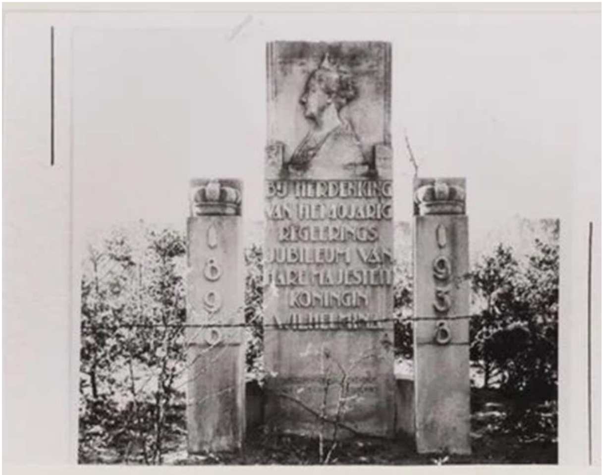
Wilhelmina monument voordat die verwoest werd