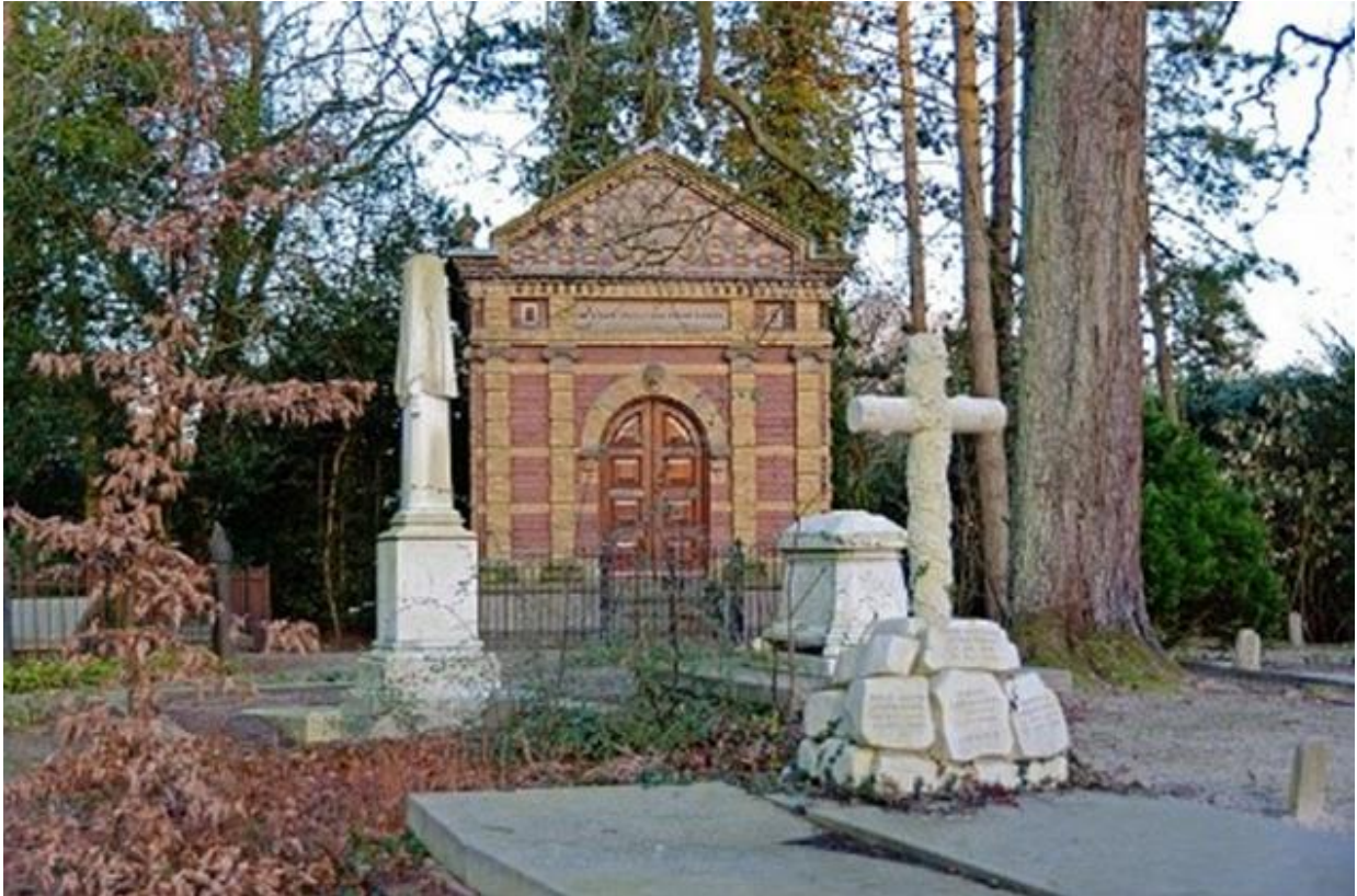
Grafkapel familie van Vollenhoven