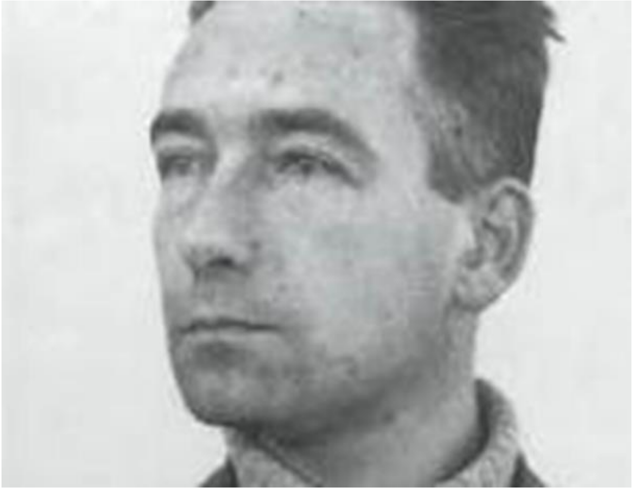
Anton van der Waals