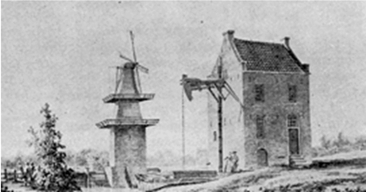
Tekening Groenendaalse molen met pomphuis en stoommachine.