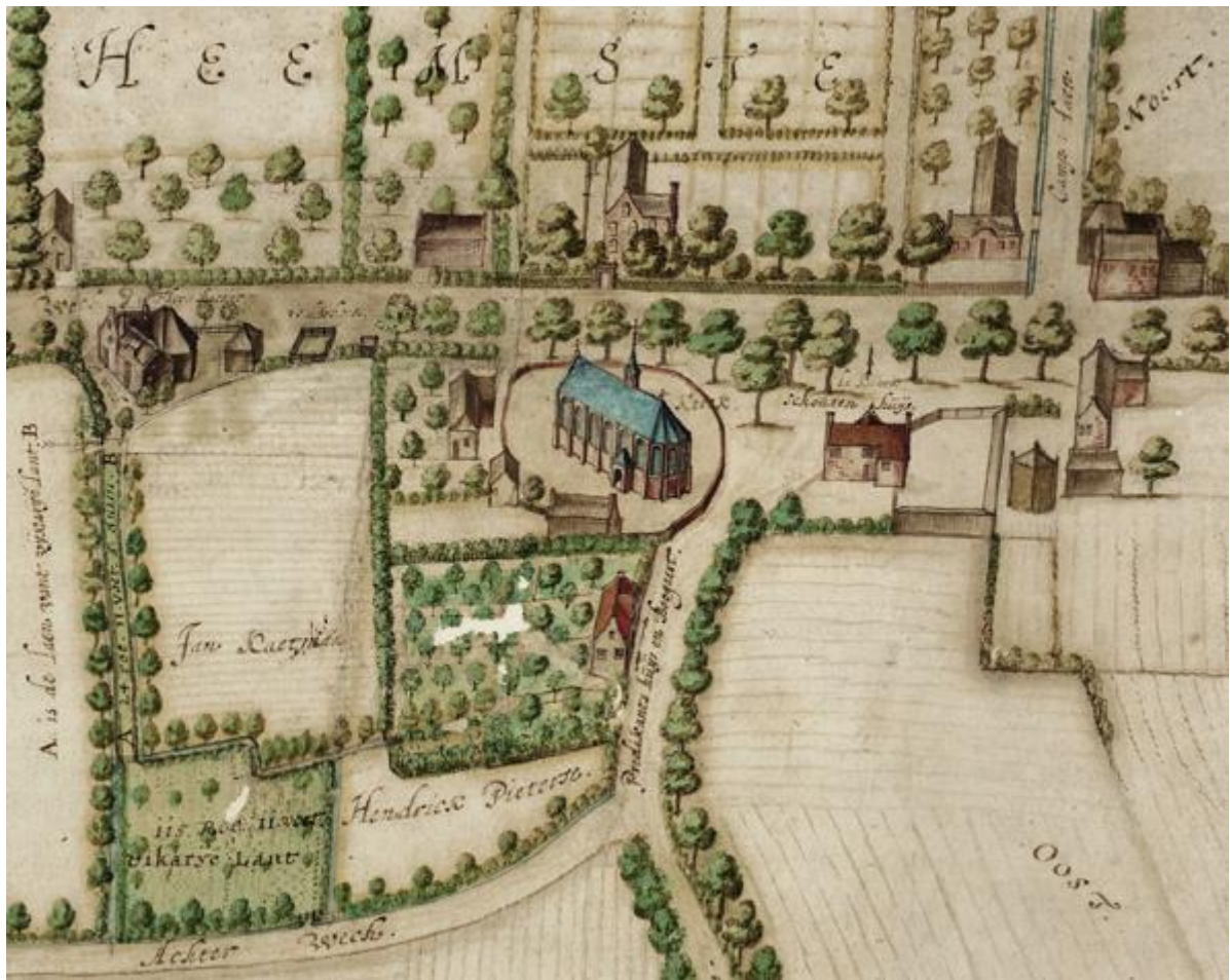
Hierop zie je Heemstede in de 17 de eeuw toen de oude kerk werd gebouwd.