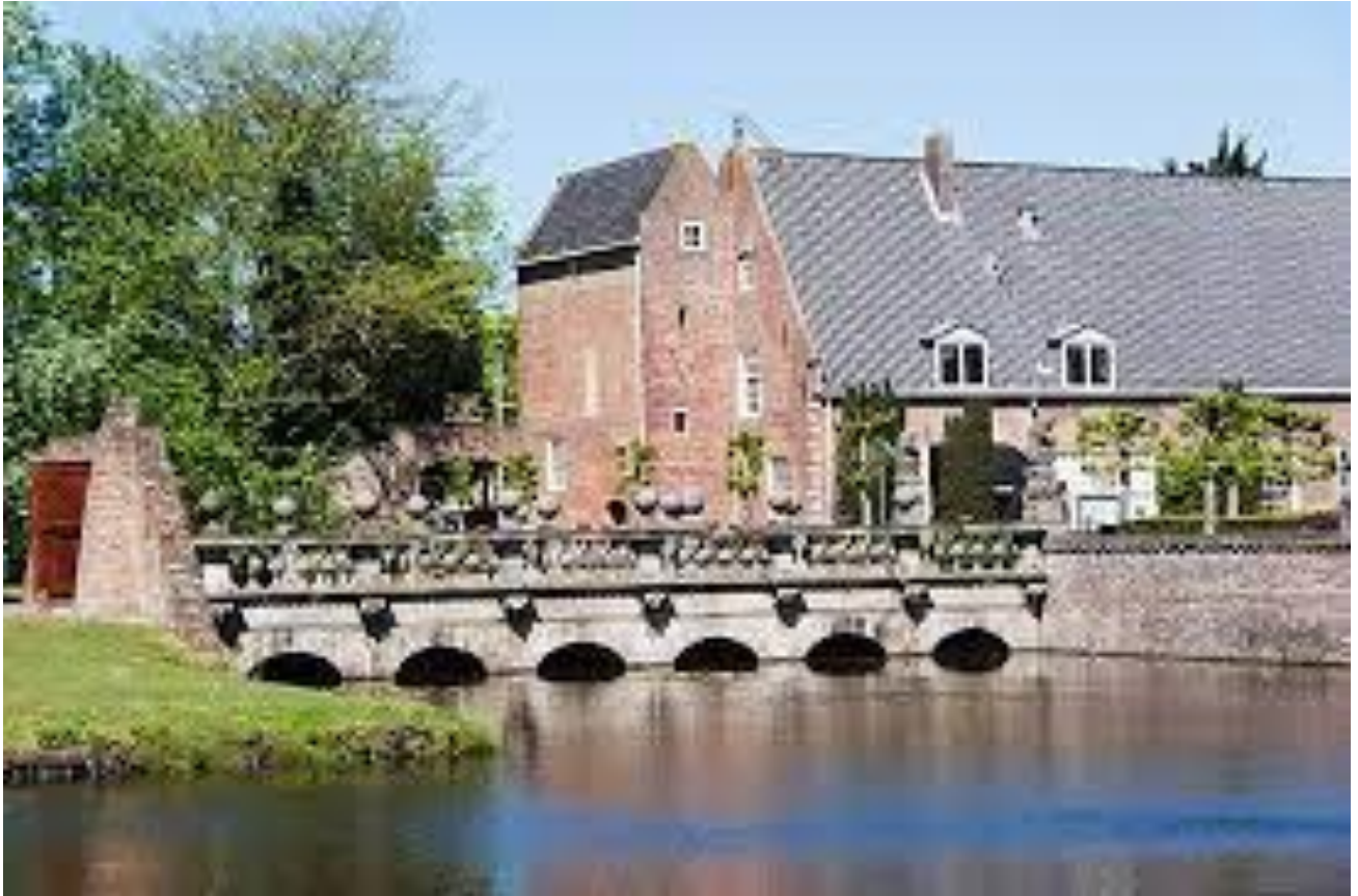
Hierop is het overgebleven koetshuis te zien van de - door Adriaan Pauw gerenoveerde renaissancekasteel - versie van het oude slot, verder is ook de vredesbrug te zien.