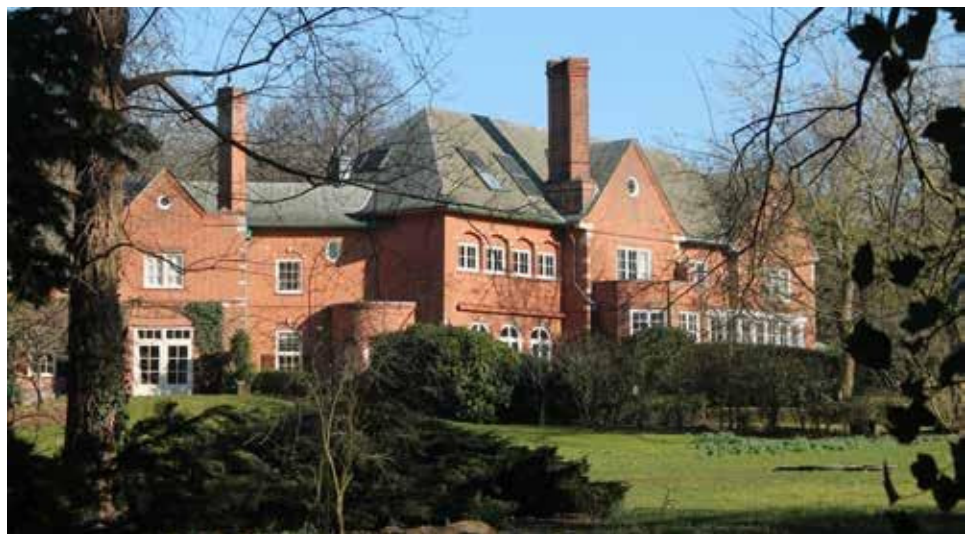
▲ Landhuis Hertenduin, Herenweg 2A, Heemstede.

Na langdurig overleg heeft de commissie de definitieve lijst samengesteld. Die zal binnenkort aan de gemeenten Heemstede en Bloemendaal gepresenteerd worden, met het verzoek deze panden en ensembles als gemeentelijk monument aan te wijzen. De lijst komt dan ook op www.hvhb.nl . We kunnen alvast verklappen dat op nummer één landhuis 'Hertenduin' te Heemstede staat.