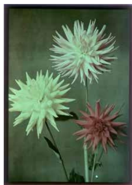
▲ Autochromen door Leendert Blok van tulpen, narcissen en dahlia's.