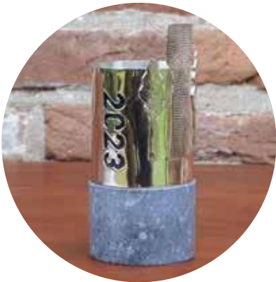
▲ De Erfgoedprijs 2023, gemaakt door Rosita van Wingerden.

Het is elke keer weer een spannend moment als tijdens de ledenbijeenkomst van de HVHB de winnaar van de Erfgoedprijs bekendgemaakt wordt. Zes genomineerden waren in de race om de zilveren trofee te mogen ontvangen. En die deden volgens de jury nauwelijks voor elkaar onder. Maar, er kan er maar één de winnaar zijn!