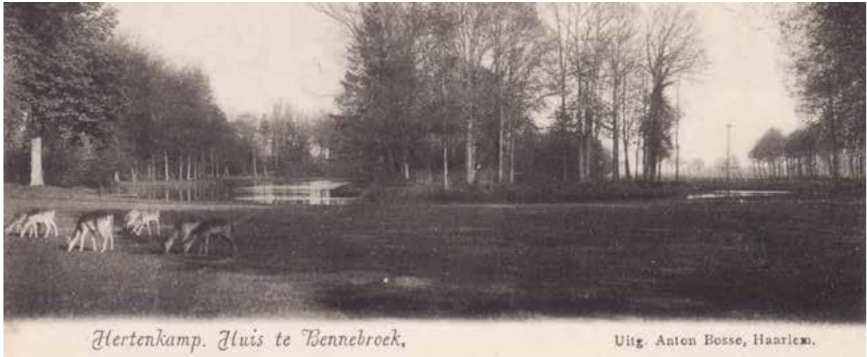
Hertenkamp. Huis te Bennebroek.