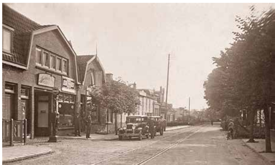
▶ De Glipperweg, gezien in de richting van Bennebroek, met links garage Meijer.

Op het voormalige terrein van buitenplaats De Meermin werd verder gebouwd