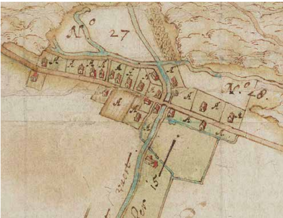
◀ Buurtschap De Glip in 1621. Detail uit de kaart van Balthasar Florisz. van Berckenrode.

De Prinsenlaan is omstreeks 1650 dwars door de duinwal gegraven als verbinding met de Herenweg. Dit is nog goed in het landschap waarneembaar. Ter hoogte van Prinsenlaan 5 kwam een brug in een zijtak van de Glippervvaart die omstreeks 1820 nog aanwezig was. Niet veel later zijn alle zandvaarten ten zuiden van de Prinsenlaan gedempt.