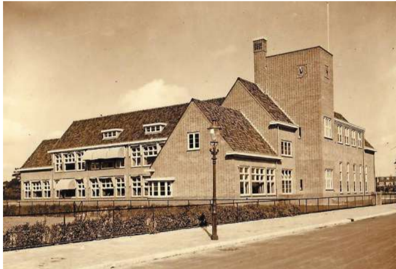
De oude Dreefschool, waar nu Plein 1 is gevestigd.

Ongeveer een jaar geleden werd de Historische Vereniging Heemstede-Bennebroek benaderd door de Rotary Club van Heemstede. Of HVHB een historische film kon maken over het dorp. De film zou vertoond kunnen worden bij de Openluchtbioscoop aan de Vrijheidsdreef van deze zomer. Na de premiere vorige maand kon de film rekenen op positieve kritieken.