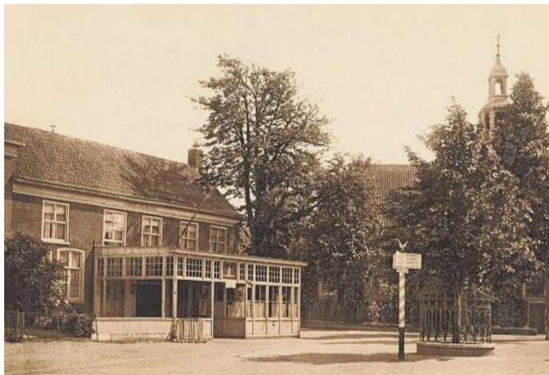
Wilhelminaplein in 1917.