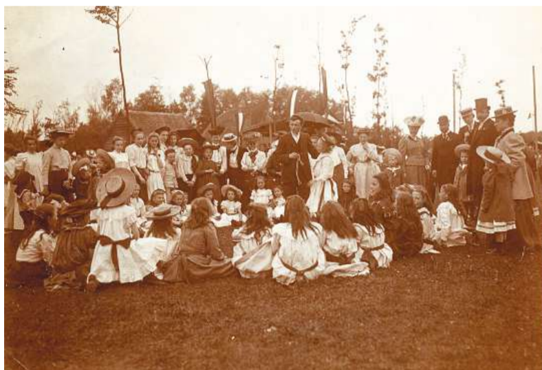
Viering 12,5 jarig jubileum burgemeester Van Lennep in 1904.