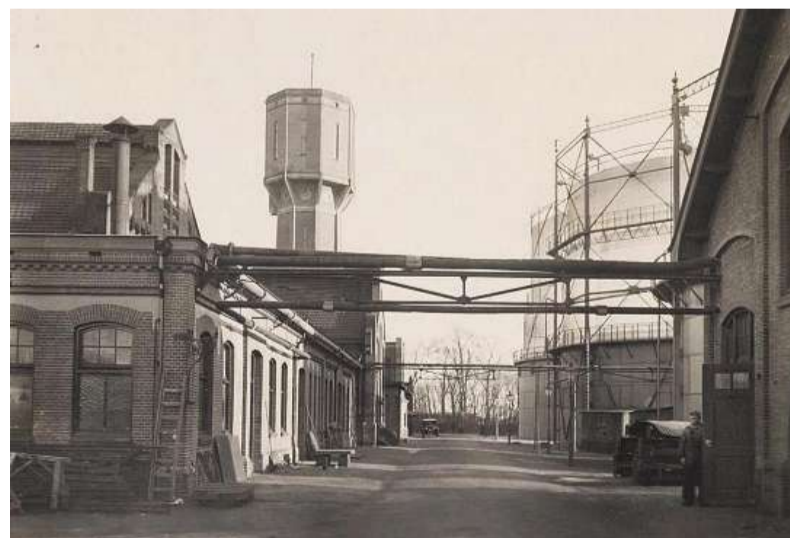
Gasfabriek en watertoren 1936