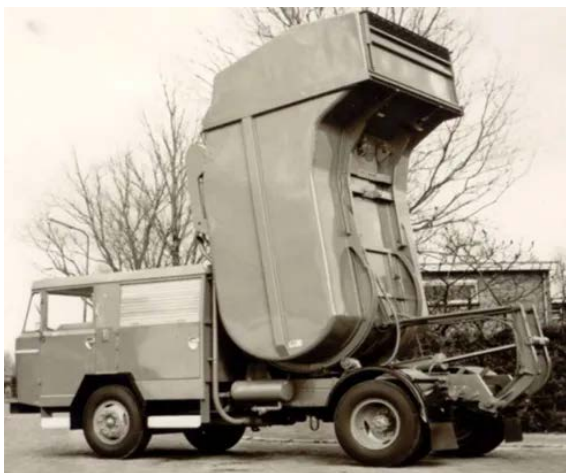
◀▲ Heemstedse vuilniswagen (boven) circa 1950. Chevrolet chassis, van een roltrommel voorzien door de firma Geesink uit Weesp. Als de bak achterin vol was, werd de trommel rechtop gekanteld (foto links) en viel die lading naar beneden. Zo kon de hele trommel effectief gevuld worden.