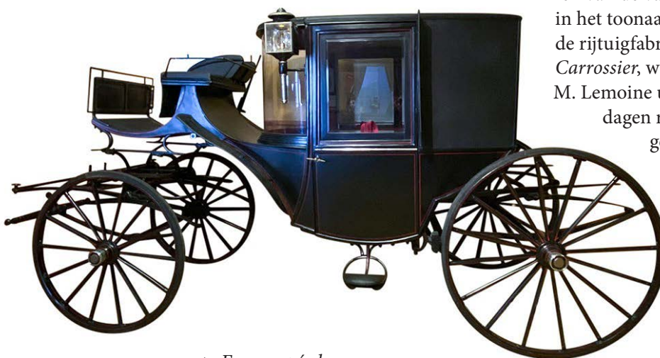
▲ Een coupé clarence.

Met het toetreden van zoon Gerrit (1844-1821) in de wagenmakerij kreeg