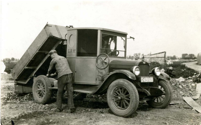
▲ Deze Chevrolet vuilniswagen, aangeschaft in 1927, had een kiepfunctie.