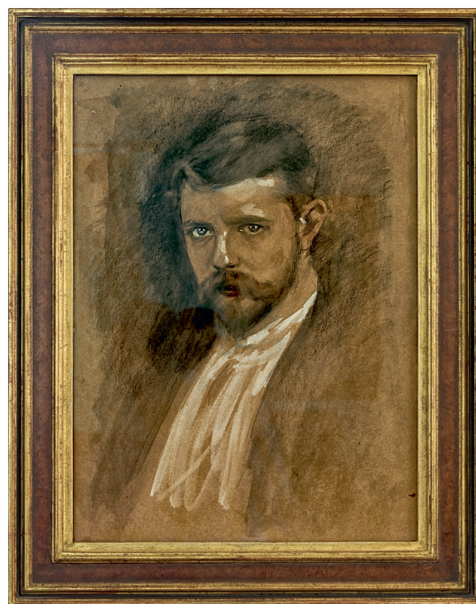
Zelfportret, zonder jaartal, crayon op papier.