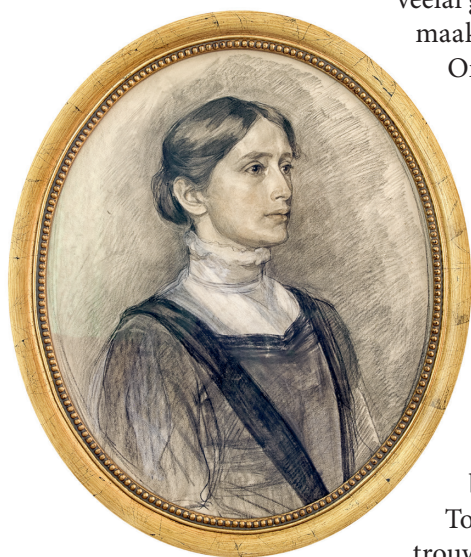
▲ Portret van een onbekende vrouw, z.j., crayon op papier. Particuliere collectie.

Cornelis Spoor schilderde, tekende en etste portretten, landschappen, stadsgezichten, bloemen, katten en vogels, alles veelal gesigneerd met C. Spoor jr. Hij maakte veel portretten in opdracht.