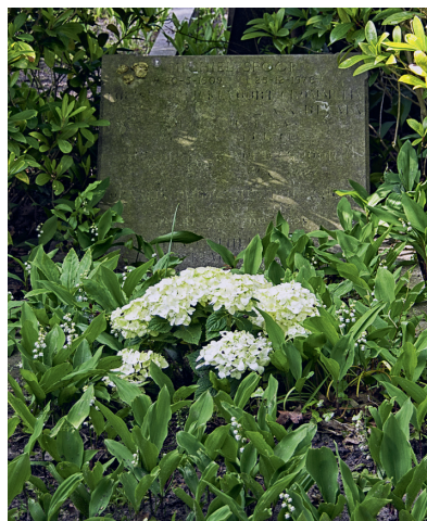
▲ Graf Cornelis Spoor, Sectie 2 Algemene Begraafplaats Herfstlaan Heemstede.

Cornelis Spoor werd in 1928 begraven in het graf van zijn schoonmoeder. Later werden hier ook zijn echtgenote en zijn jongste zoon bijgezet. Het graf-