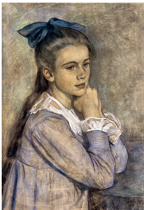
▲ Portret van mej. M.M. Lechner, z.j., crayon. Particuliere collectie.

► Oude Baker Versjes geïllustreerd door C. Spoor, herdruk van de editie van 1905 met gewijzigd omslag en titel, 1924. Dit boek en ook Piet de Smeerpoets staat volledig op https://geheugen.delpher.nl/