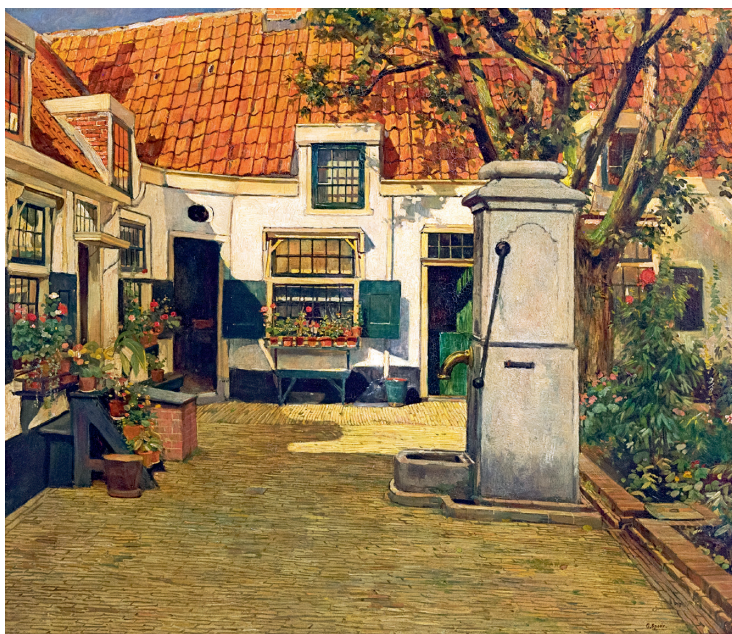
▲ Hofje van Loo of St. Elisabeth's Gasthuishofje, Barrevoetstraat Haarlem, z.j. Particuliere collectie.