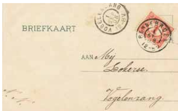
▲ Briefkaart met een grootrondstempel Bennebroek-Vogelenzang 1 september 1908. Een naam en de vermelding Vogelenzang was voldoende om de post op het juiste adres te bezorgen.