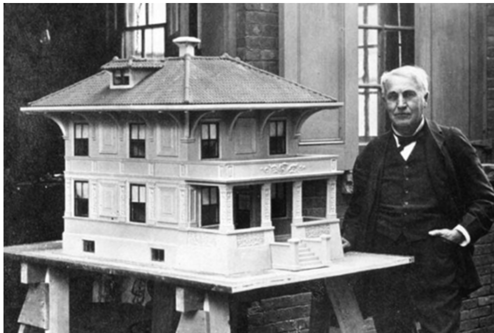
► Thomas Edison met een model van een betonnen huis in 1911.

Aan de Bronsteeweg 19 in Heemstede staat een betonnen huis uit de beginjaren van het bouwen in gietbeton en gewapend beton in Nederland. Het is een voor die tijd zeldzaam voorbeeld van een particulier woonhuis in beton.