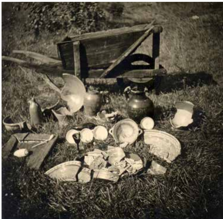
▲ Voor de houten kruitwagen liggen de vondsten uitgesteld. Links een waterkruik, rechts de kan. Foto uit 1956.