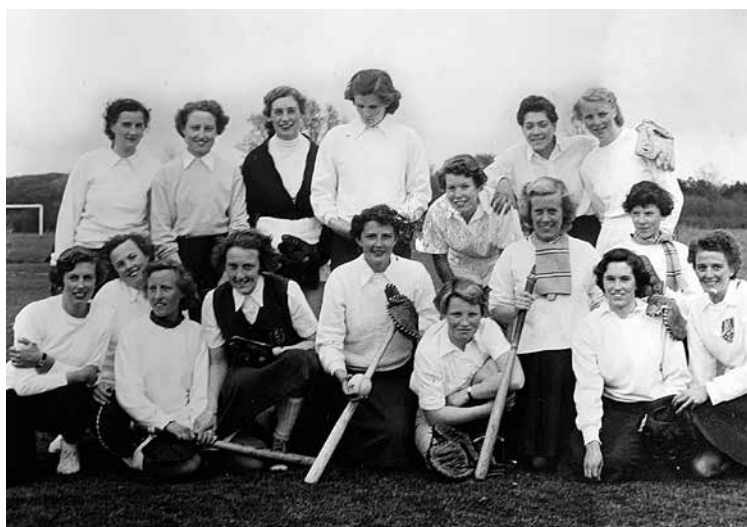
► Damessoftbalteam RCH in 1950.

In die jaren kwam er een behoorlijke toeloop van nieuwe leden bij het herensoftbal, zowel op recreatief niveau als in de topsport.