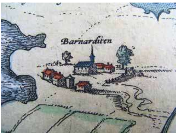
▲ Het klooster Barnarditen op de kaart uit 1588, uitgegeven door Braun en Hogenberg. Het noorden is beneden.

bezoeken en namen dan ook vaak al bestaande afbeeldingen als voorbeeld. Toen het boekje over de historie van de Hemelpoort werd samengesteld, was het klooster allang vervangen door de buitenplaats Het Klooster . Het is dus begrijpelijk dat de auteurs het plaatje op het titelblad baseerden op een van de weinige vroegere tekeningen van het verdwenen klooster.