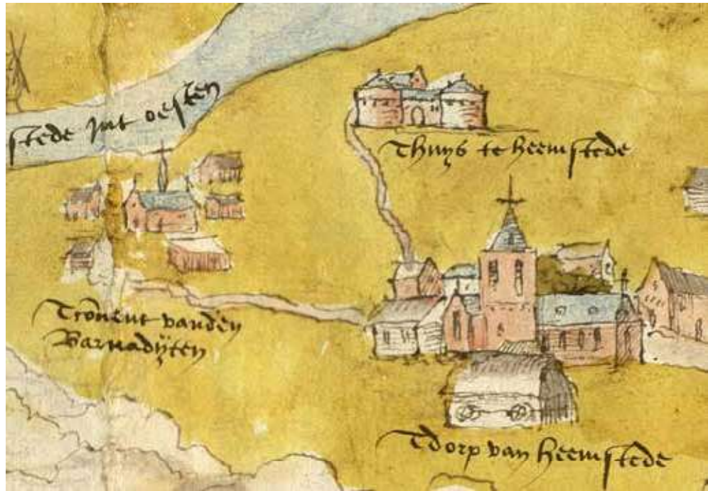
▲ Vanuit het dorp ging de Hoflaen naar t Huys te Heemstede en de Munneke Laen naar t Convent vanden Barnaditen. Uitsnede van de kaart van Sijmon Meeusz uit 1539. Het noorden is links.

Hazenberg noemde – is nog steeds het gave kloostercomplex te zien.