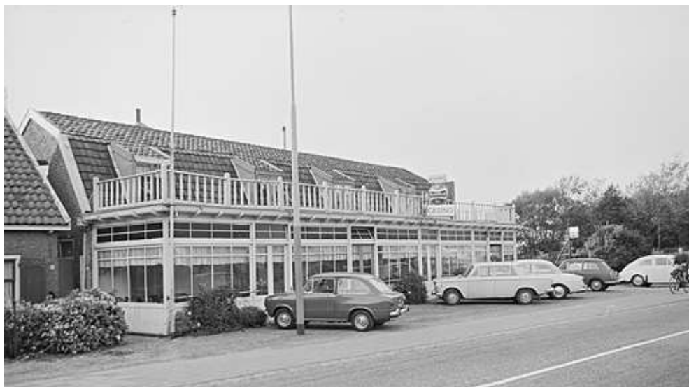
▲ Oud Berg en Dal met het uithangbord 'Casino', 1965.