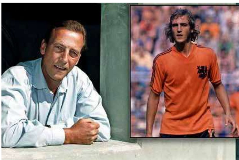
▲ Johan Neeskens, links op latere leeftijd en rechts in 1974 in het shirt van Oranje.

Op 6 oktober 2024 overleed op 73-jarige leeftijd Johan Neeskens. In de jaren zeventig was hij een wereldwijd bekende en geliefde voetballer. Hij is geboren en getogen in Heemstede en kwam er ook nog regelmatig terug.