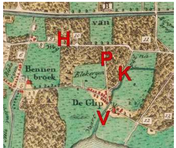
▲ Detail van de kaart van landmeter Engelman uit 1794. P. Prinsenlaan, K. Kadijk, V. Glipperzandvaart, H. Herenweg (Haagsche Straatweg, nu Rijksstraatweg). Noorden rechts.

Voordat de Woningwet van 1901 in werking trad, bestond er nauwelijks sociale woningbouw in Nederland. Veel (arbeiders)gezinnen woonden begin