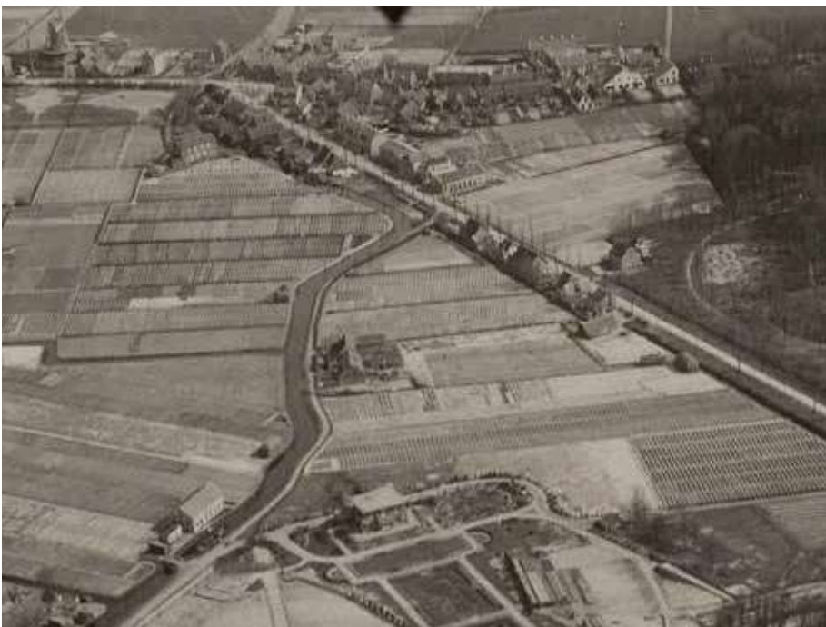
◀ Luchtfoto uit 1925: onderaan landgoed Dennenheuvel. De kronkelige Kadijk richting Prinsenlaan is goed te zien in het midden van de foto.

len van de Heemsteedse raadsvergaderingen blijkt dat dit ook regelmatig gebeurde. Daarnaast was in de wet geregeld dat het Rijk via gemeenten geldleningen ter beschikking stelde aan goedgekeurde woningbouwverenigingen, om zonder winstoogmerk nieuwe huizen te bouwen. Berkenrode, opgericht in 1909, was de eerste woning-